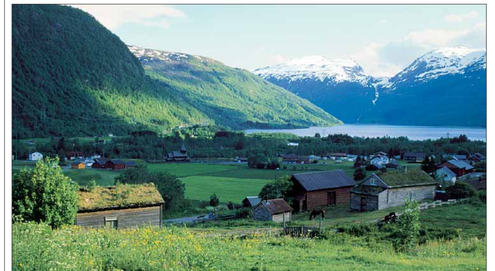
Bygdetunet i Roldal er eit lite småbruk på « Haugen » eit stykke ovanfor kyrkja – eit mangeårig museumsprosjekt som vart til røyndom då Roldal gjekk inn i Odda kommune i 1964.

På den andre sida av fjorden, ligg AGATUNET ; med i alt 30 bygningar i det gamle klyngjetunet; i 1938 som ei eiga stiftung. I 1975 fekk Agatunet status som museum under den nye tilskottsordninga. Agatunet har i dag eit nært samarbeid med Hardanger folkemuseum om ein halv handverkarstilling, men det er framleis ein