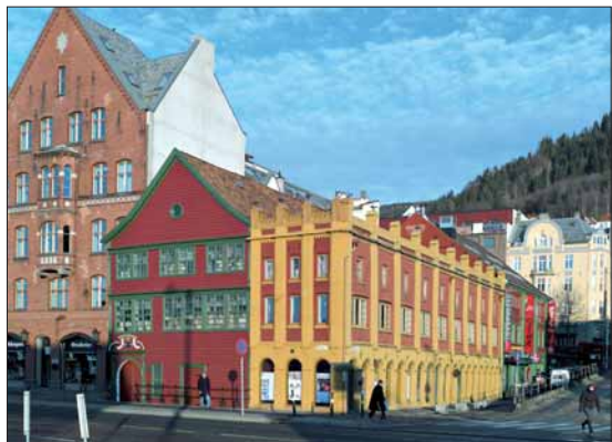
Det Høstetiske Museum