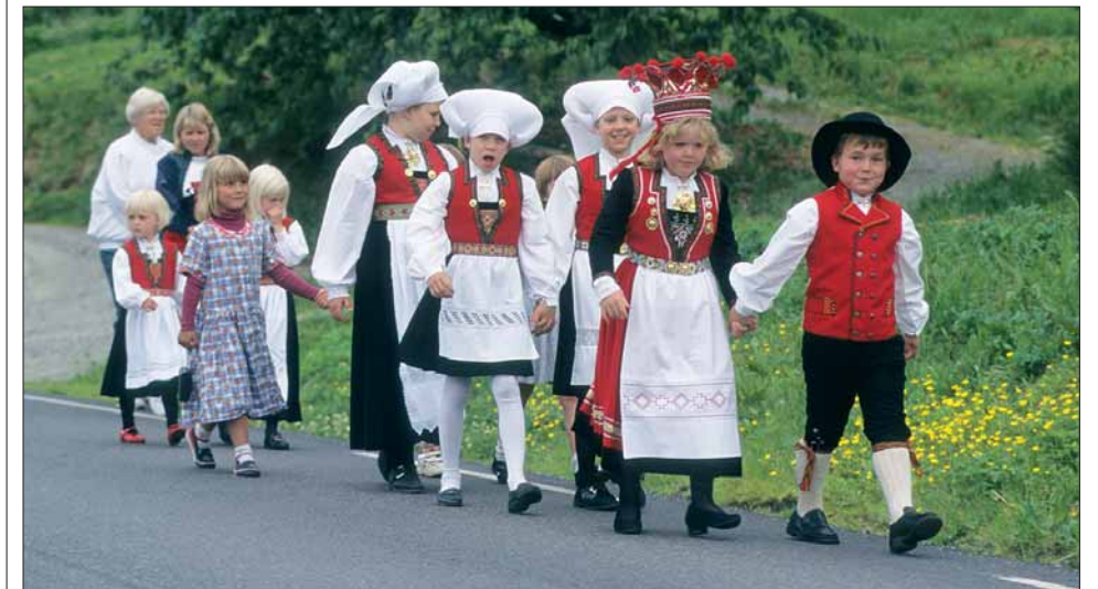
Det er jonsok og barnebrudlaup i museumstunet på Utne. Også dei levande kulturtradisjonane høyrer med.

OSTERØY MUSEUM på Gjerstad hadde frå først av det tidstypiske namnet GJERSTAD FORNMINNELAG . Det vart skipa i 1920, og i 1930 fekk laget eigande tomt og byrja å setja opp eldre bygningar frå 1600- og 1700-talet. Gjennom åra har museet bygt opp eit tun med stover, eldhus og eit renessanseloft: Fjellskalnesloftet,