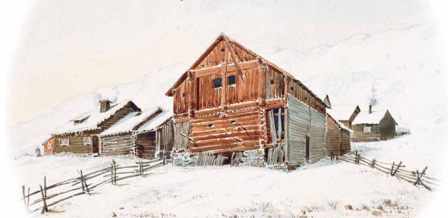
Finnesloftet. Akvarell av Peter E Blix, 1888.

Idéane som låg bak dette museums-tiltaket, var tankar som hadde sin bakgrunn