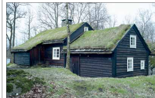
Oenhuset frå Øygarden slik det i dag står på Hordamuseet (®285).

barskt kystlandskap. I dette landskapet ligg også eit anna tematisk museum: NORDSJØFARTMUSEET , bygt på dei krigshistoriske samlingane i Telavåg (®277). Her får vi eit nærbilete av lokalsamfunnet i motstand mot overmakta. Dei ideologiske haldningane som kjem fram i Telavåg, kampen mot diktaturet, er ein viktig del av kulturarven, ikkje berre den norske, men den europeiske. Og kunnskapen om kulturlandskapet og det økologiske miljøet er tema som står i fokus for dagens informasjonssenter om landskapsvern og kulturhistorie, slik vi ser det i nasjonalparkane på Folgefonnhalvøya og Hardangervidda. Kunnskapen flytter ut i landskapet og inn i lokalsamfunnet. □