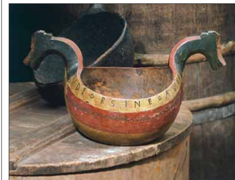
Revitalisering av den gamle handverkskunsten var ein del av Kunstindustrimuseet sitt program.

Naturleg nok er det eit fagleg fellesskap mellom Sjøfartsmuséet, Fiskerimuséet og folkemusea i Hordaland når det gjeld sjøbrukskulturen, og hovudtyngda av det som er verna av gamle bruksbåtar, ligg ute i distriktet. Dei gamle båtbyggjarane, som har vore aktive heilt til våre dagar, representerer dei stoltaste handverkstradisjonane i norsk historie, med røter i vikingtida sine båttypar.