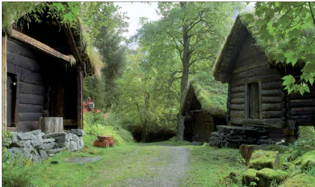
418 Stalheim Museum.

Staden er samstundes eit monument over nasjonalromantikken som periode, og hovudbygningen er eit malerisk døme på hitorismens motivlån og dekkorglede. I 1973 overtok Fornminneforeningens Bergensavdeling Lysøen som gåve, og i 1977 fekk eigedommen status som museum (®240).