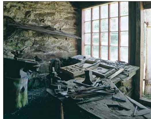
Den gamle læsesmia i Bloddalen ved Osterøy Museum.

HORDAMUSÉET , som tidlegare hadde namnet Hordaland landbruksmuseum, vart skipa i 1945, med utgangspunkt i fagmiljøet ved Stend landbruksskule i Fana. Frå starten som spesialmuseum utvikla landbruksmuséet seg i retning av eit distriktsmuseum for Nord- og Midthordland, og det var nok mange som såg føre