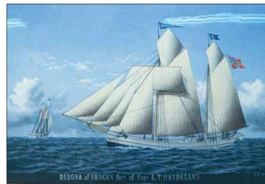
Dokumentasjon av skip og skipstypar er ein del av det store materialet Bergens Sjøfartsmuseum forvalter. Skuteportrett av jaketgaleas «Deboras», av F. Sørvig, 1875.

I 1880 sende SELSKABET FOR DE NORSKE FISKERIERS FREMME ein stipendiat til den internasjonale utstillinga i Berlin, og overtok samstundes dei modellane som var samla ved Bergens Museum. Dette vart opptakten til « BERGENS FISKERIMUSEUM », som i 1882 fekk lokale i basarbygningen på Vetrilidsalmenningen. Frå 1896 har muséet halde til i nedre etasje av «Permanenten» (Den Permanente Utstillingsbygning), og i 1990 vart endeleg plassproblema løyste ved flytting til Bontelabo. Nettopp plassproblema for eit