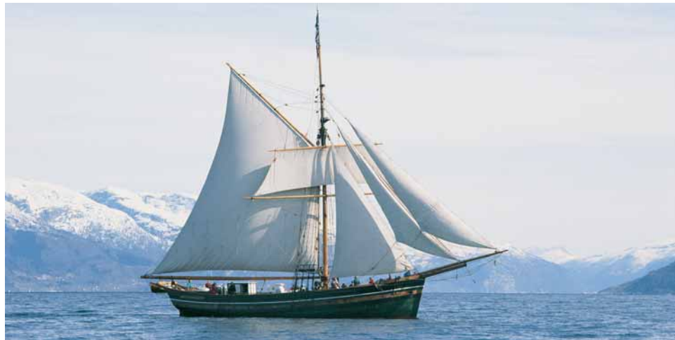
Den restaurerte hardangerjakta «Mathilde» dreg rundt med utstillingar. Eit samarbeid mellom Hardanger Fartøyvernssenter og Hardanger Folkemuseum.

Etter krigen har nok det kommunale engasjement vorte sterkare i slike lokale tiltak. VIKTUNET i Jondal vart skipa som eit bygdetun i slutten av 1960-åra, då Jondal kommune kjøpte den gamle lensmannsgarden på Vik. Idag er det eit kommunalt museum med eige styre. Og nettopp i slike høve kjem dei faglege og tekniske ressursane ved distriktsmuséet inn som ein viktig faktor for å kunna forvalta lokale bygdetun på ein god måte (®380).