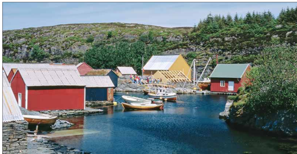
Kulturvern er ei sak for lokalsamfunnet, ein del av det lokale miljøarbeidet. Restaurering av sjøbruksmiljøet i Ovågen, Øygarden. Bilete frå 1990-talet

Eit museum som også viser dette, er KYSTMUSÉET i Øygarden. Det hentar fram kvardagssoga i dei små fiskarsamfunna mot Nordsjøen, i eit karrig og