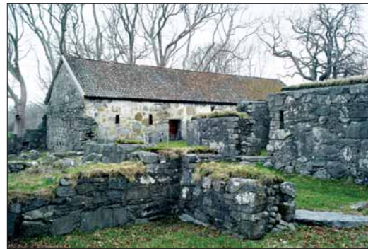
Frå Halsnøy kloster.

Eit vernetiltak «in situ» som også ligg under Sunnhordland Folkemuseums ansvar, er gruvemuséet på LITLABØ (®212). Men det finst andre vernetiltak i Sunnhordland, som viser oss kva den lokale verneviljen kan utretta. BAADEHUSET i Espevær, hovudbygningen på den gamle handelsstaden og administrasjonssenteret i det rike sildefisket på 1800-talet, vart i 1969 overlata ESPEVÆR HUSMORLAG frå dei tidlegare eigarane. Med tilskott frå Norsk kulturråd og frå Riksantikvaren, og med fagleg støtte frå antikvariske styresmakter har husmorlaget – med menn – gjennomført ei fullstendig restaurering av bygningen, frå kjellar til loft. Interiøret er tilbakeført og det gamle bakeriet er istand-